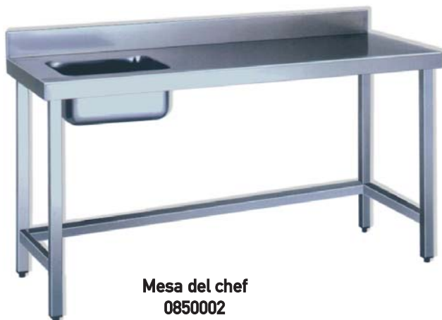
Mesa del chef 0850002 0850004