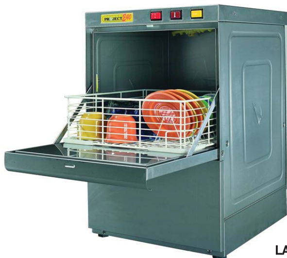
LAVAVASOS 5421001 / 5421002