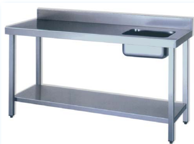
Mesa del chef con estante