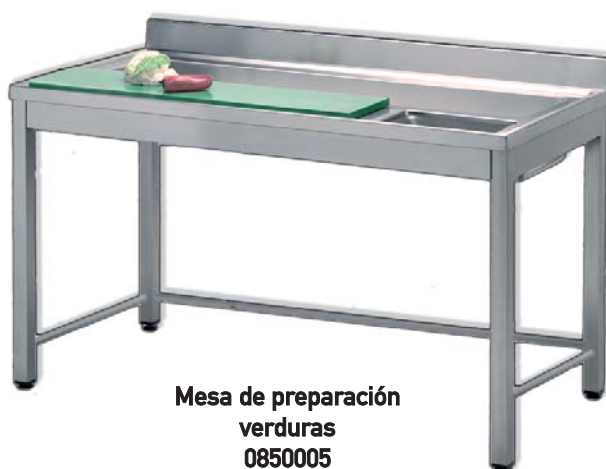
Mesa de preparación verduras 0850005