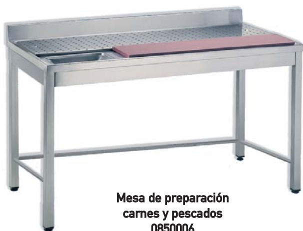
Mesa de preparación carnes y pescados 0850006 0850007